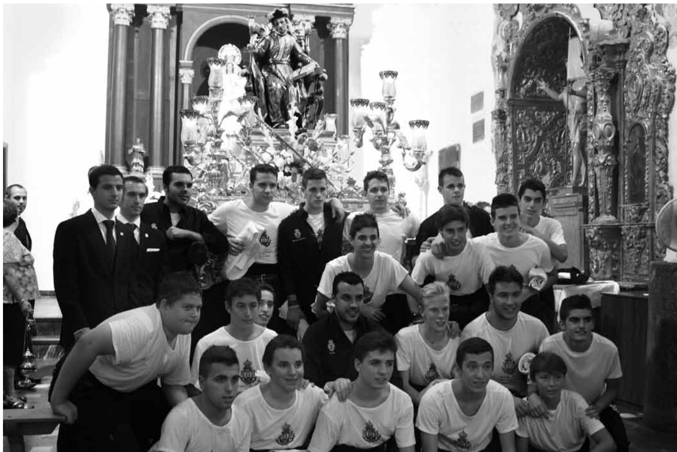
La cantera de jóvenes costaleros soleanos el pasado 9 de septiembre, tras la procesión de nuestro Patrón San Gregorio de Osset