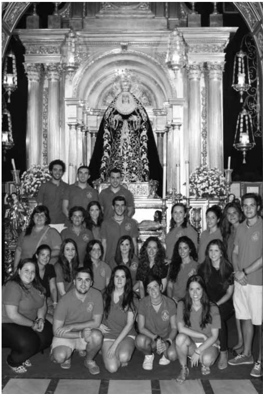
Equipo de monitores de la XII edición de las Colonias

Tras aquella primera toma de contacto y sin dejar de tener presentes a todos aquellos maestros-monitores que en cierto modo nos dieron el relevo (afortunadamente algunos aún siguen), transcurrieron reuniones, fueron saliendo ideas, las ideas se fueron materializando y poco a poco ese grupo que empezó con unas ganas contenidas, fue fortaleciéndose y soltando cada gramo de esa ilusión que más tarde inundaría el Peñón de Algámitas. Y es que cada uno de nosotros nos fuimos convirtiendo, casi sin darnos cuenta, en esos niños que