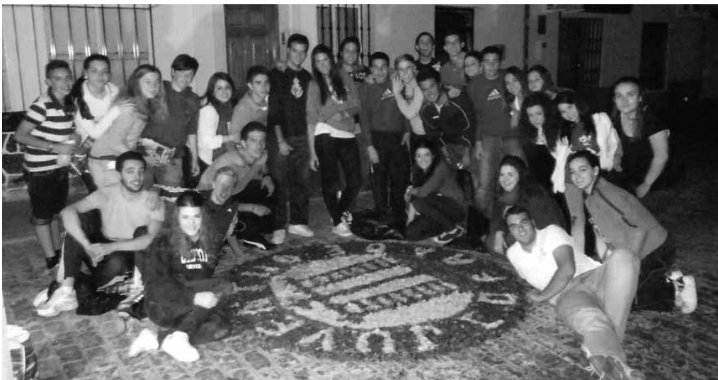
Jóvenes soleanos preparando la alfombra para el Santísimo en la víspera del Corpus

Recientemente hemos podido apreciar cómo ha mejorado el ornamento de la fiesta del Corpus Christi en nuestro pueblo. No es de extrañar, ya que la Juventud Cofrade se propuso con motivo de su XXX Aniversario recuperar una tradición de las de antaño,